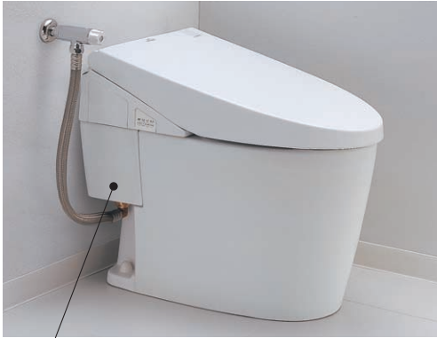
リモデルの場合、パネルはハーフサイズになります。